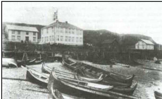
Her er et bilde fra Loppa ca 1900 med skolen til venstre og prestegården til høyre og handelsmannens hus i midten og med båtene i støa